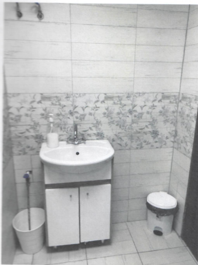
Фото 11. Санитарная комната