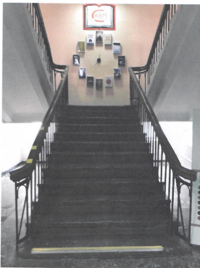
Фото 4. Лестница на 2 этаж