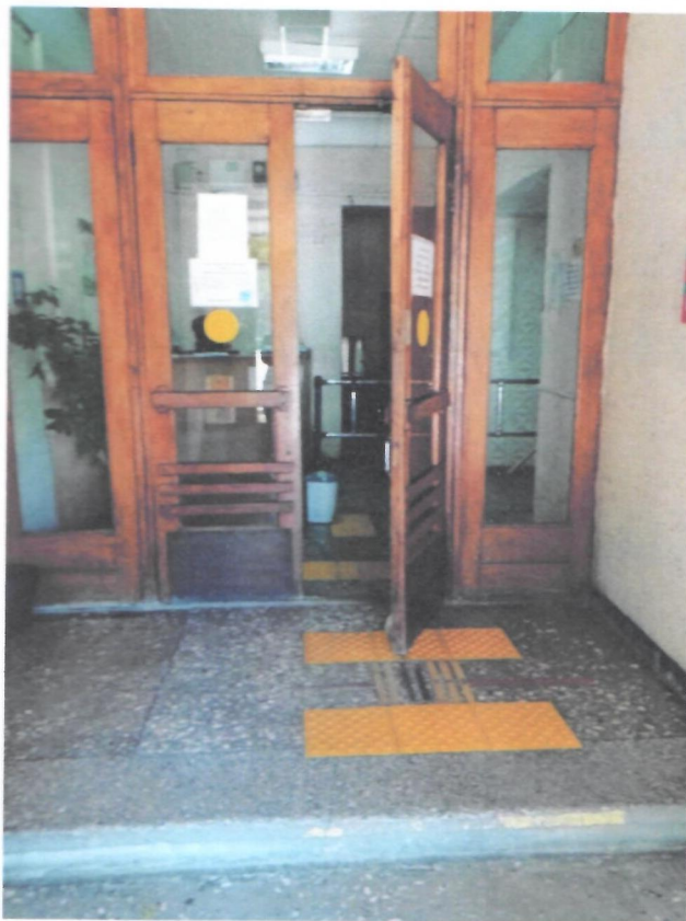
Фото 3. Входная группа на объекте