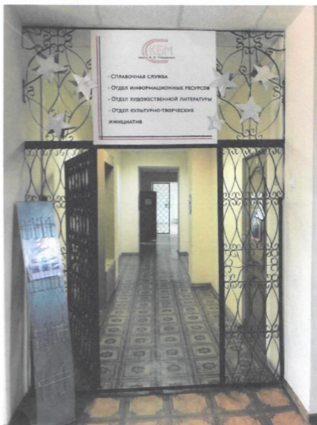
Фото 6. Путь движения в здании библиотеки