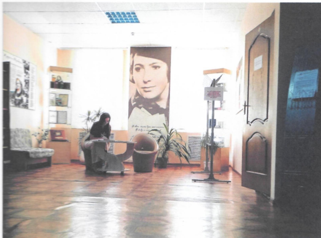
Фото 5. Холл библиотеки