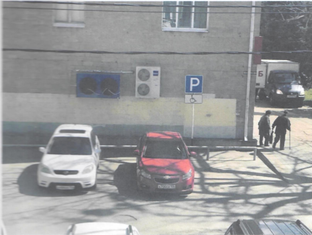
Фото 13. Автомобильная стоянка для инвалидов