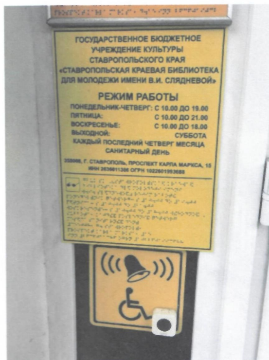
Фото 2. Информационная табличка на входе в библиотеку