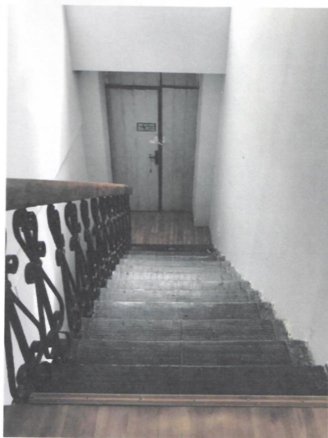
Фото 12. Аварийный выход