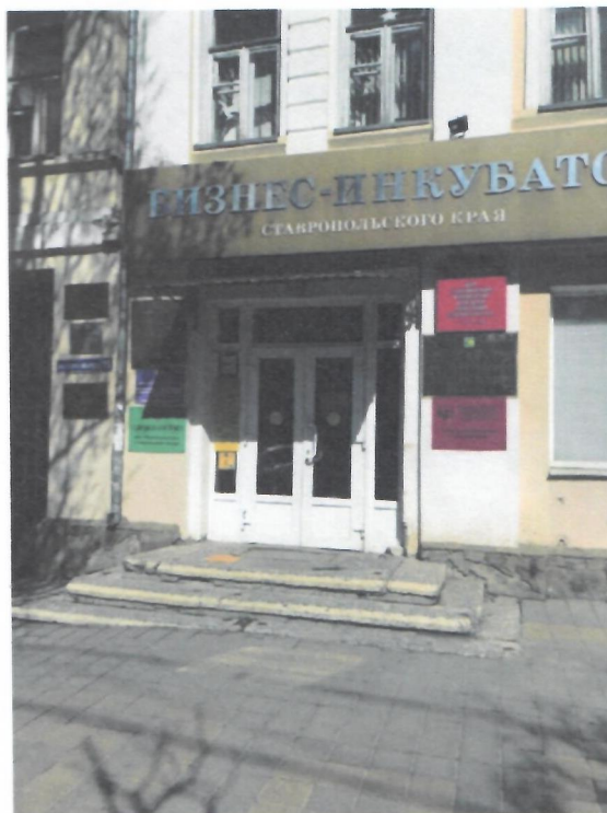
Фото 1. Вход в библиотеку