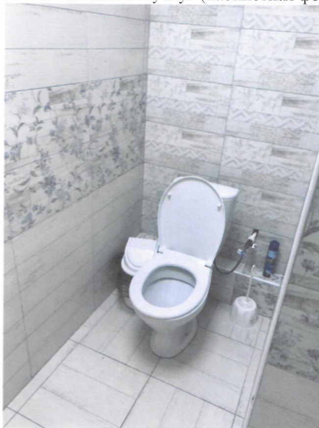
Фото 10. Санитарная комната