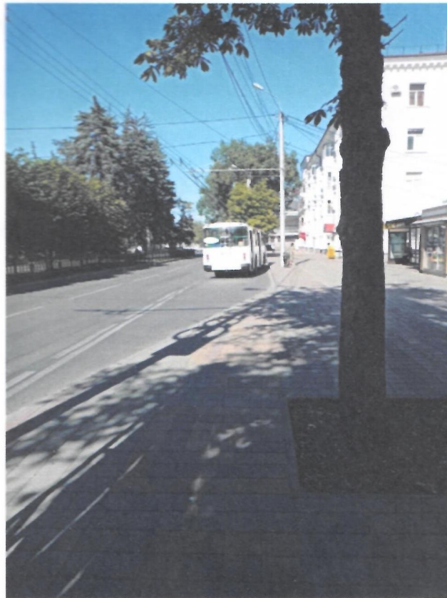
Фото 14. Съезд на пешеходную дорожку с остановки