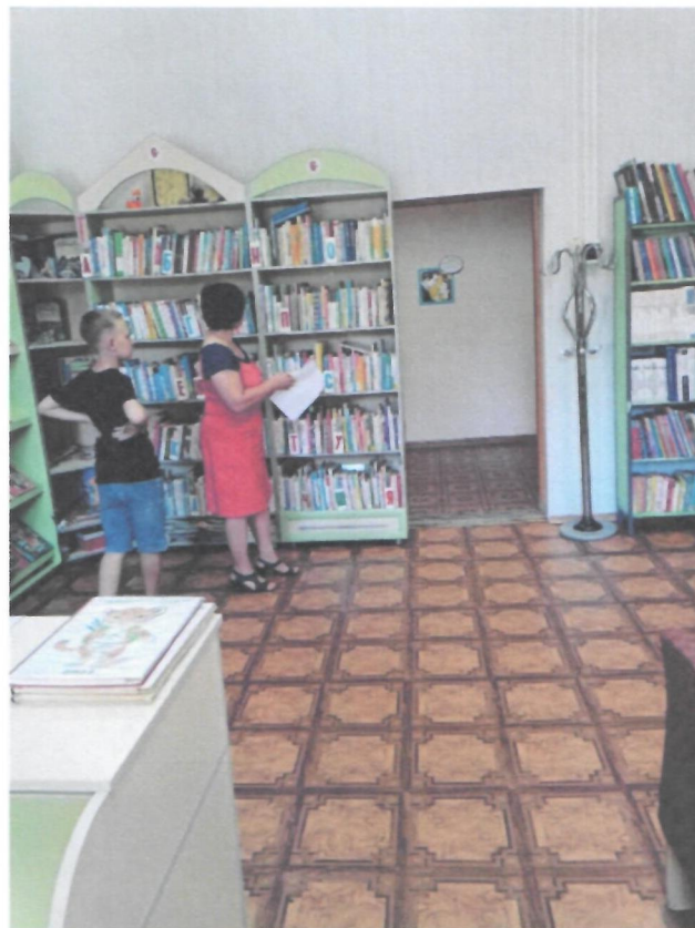
Фото 8. Зона оказания услуг (кабинетная зона)