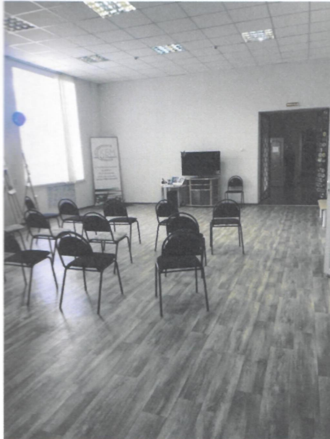
Фото 7. Зона оказания услуг (зал)