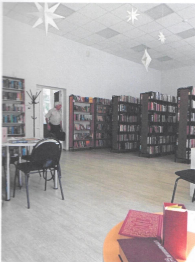
Фото 9. Зона оказания услуг (кабинетная форма)